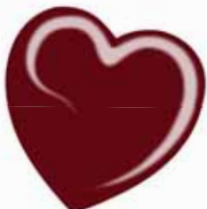
ChicLacq Borgogna Smalto UV/LED Soak-Off colore Rosso scuro MK9544