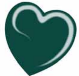
ChicLacq Cipresso Smalto UV/LED Soak-Off colore verde intenso MK9596