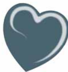
ChicLacq Azzurretto Smalto UV/LED Soak-Off colore azzurro grigio MK9572