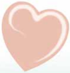
ChicLacq Timidezza Smalto UV/LED Soak-Off colore rosa pallido MK9622