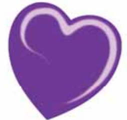
ChicLacq Elettrico Viola Smalto UV/LED Soak-Off colore viola elettrico MK9588