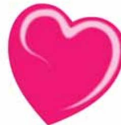
ChicLacq Sexyrosso Smalto UV/LED Soak-Off colore rosso magenta MK9610