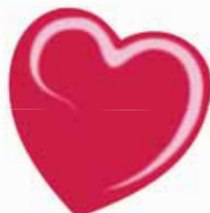
ChicLacq Lampone Smalto UV/LED Soak-Off colore rosso intenso MK9504