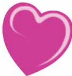
ChicLacq Rosa Fluo Smalto UV/LED Soak-Off colore rosa fluo MK9538