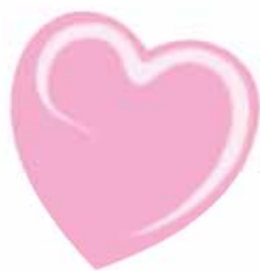
ChicLacq Orchidea Smalto UV/LED Soak-Off colore rosa lilla MK9608