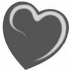
ChicLacq Grigetto Smalto UV/LED Soak-Off colore grigio scuro MK9576