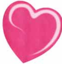
ChicLacq Cuorerosa Smalto UV/LED Soak-Off colore rosa vivo scintillante MK9618