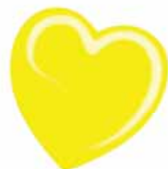
ChicLacq Limone fluo Smalto UV/LED Soak-Off colore giallo fluo MK9524