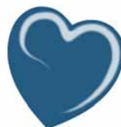
ChicLacq Petrolio Smalto UV/LED Soak-Off colore blu petrolio MK9516