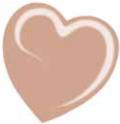
ChicLacq Avorio Smalto UV/LED Soak-Off colore beige chiaro MK9590