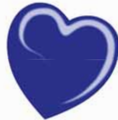
ChicLacq Elettrico Blu Smalto UV/LED Soak-Off colore blu elettrico MK9584