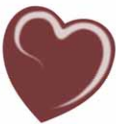
ChicLacq Cardinaletto Smalto UV/LED Soak-Off colore bordeaux grigio MK9568