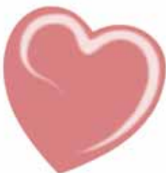
ChicLacq Rosa D'Oriente Smalto UV/LED Soak-Off colore rosa salmone MK9606