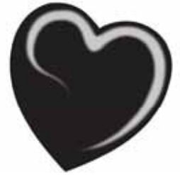
ChicLacq Mistnero Smalto UV/LED Soak-Off colore nero MK9580