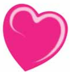
ChicLacq Fragola fluo Smalto UV/LED Soak-Off colore rosso rosa MK9520