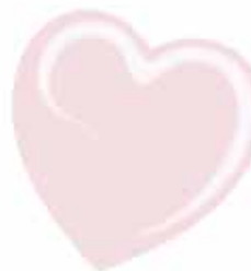
ChicLacq Bebè Smalto UV/LED Soak-Off colore rosa tenue MK9530