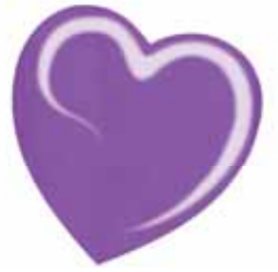
ChicLacq Fiore Esotico Smalto UV/LED Soak-Off colore orchidea scintillante MK9620