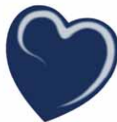
ChicLacq Bluejeans Smalto UV/LED Soak-Off colore blue jeans scuro MK9532