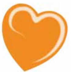
ChicLacq Aranciata Smalto UV/LED Soak-Off colore arancione MK9560