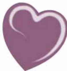
ChicLacq Prugnetto Smalto UV/LED Soak-Off colore prugna grigio MK9570