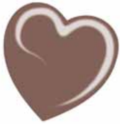
ChicLacq Castagnetto Smalto UV/LED Soak-Off colore castano grigio MK9574