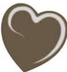
ChicLacq Fango Smalto UV/LED Soak-Off colore fango MK9526