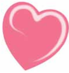
ChicLacq Rosé Smalto UV/LED Soak-Off colore rosato intenso MK9616