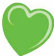
ChicLacq Lime fluo Smalto UV/LED Soak-Off colore verde fluo MK9522