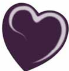
ChicLacq Violetto Smalto UV/LED Soak-Off colore viola scuro MK9502