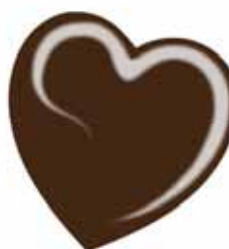
ChicLacq Cioccolato Smalto UV/LED Soak-Off colore marrone MK9514