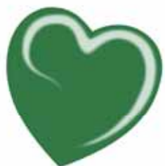
ChicLacq Foglia Smalto UV/LED Soak-Off colore Verde foglia MK9562