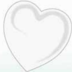
ChicLacq Lunalatte Smalto UV/LED Soak-Off colore bianco pieno MK9624