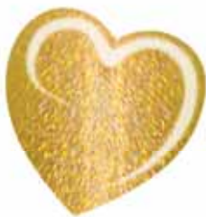
ChicLacq Pepita Smalto UV/LED Soak-Off colore oro MK9598