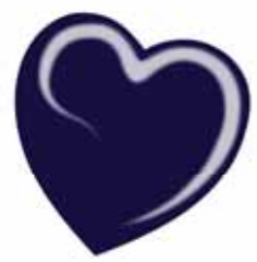
ChicLacq Bacca Smalto UV/LED Soak-Off colore viola-blu MK9600