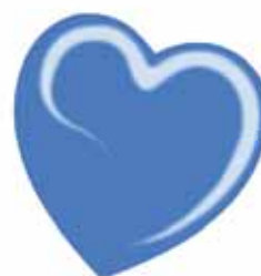
ChicLacq Oceano Smalto UV/LED Soak-Off colore Blu vivace MK9556