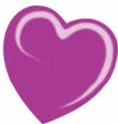
ChicLacq Magenta Smalto UV/LED Soak-Off colore viola fucsia MK9566