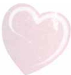
ChicLacq Luce confetto Smalto UV/LED Soak-Off colore rosa MK9510