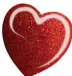
ChicLacq Rame Smalto UV/LED Soak-Off colore rosso ramato MK9512