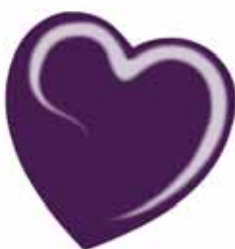
ChicLacq Giglio Viola Smalto UV/LED Soak-Off colore viola scuro MK9554