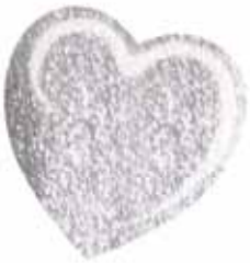
ChicLacq Alluminio Smalto UV/LED Soak-Off colore argento MK9582