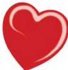
ChicLacq Papaya Smalto UV/LED Soak-Off colore arancione intenso MK9506