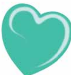
ChicLacq Acquamarina Smalto UV/LED Soak-Off colore verde acquamarina MK9552