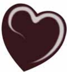
ChicLacq Nerosso Smalto UV/LED Soak-Off colore rosso scuro quasi nero MK9528