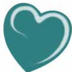
ChicLacq Oltremare Smalto UV/LED Soak-Off colore blu verde MK9564