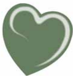
ChicLacq Militare Smalto UV/LED Soak-Off colore verde divisa MK9534