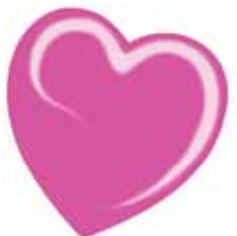
ChicLacq Scarlatto Smalto UV/LED Soak-Off colore Violetto rosa MK9542