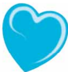
ChicLacq Turchese Smalto UV/LED Soak-Off colore turchese MK9550